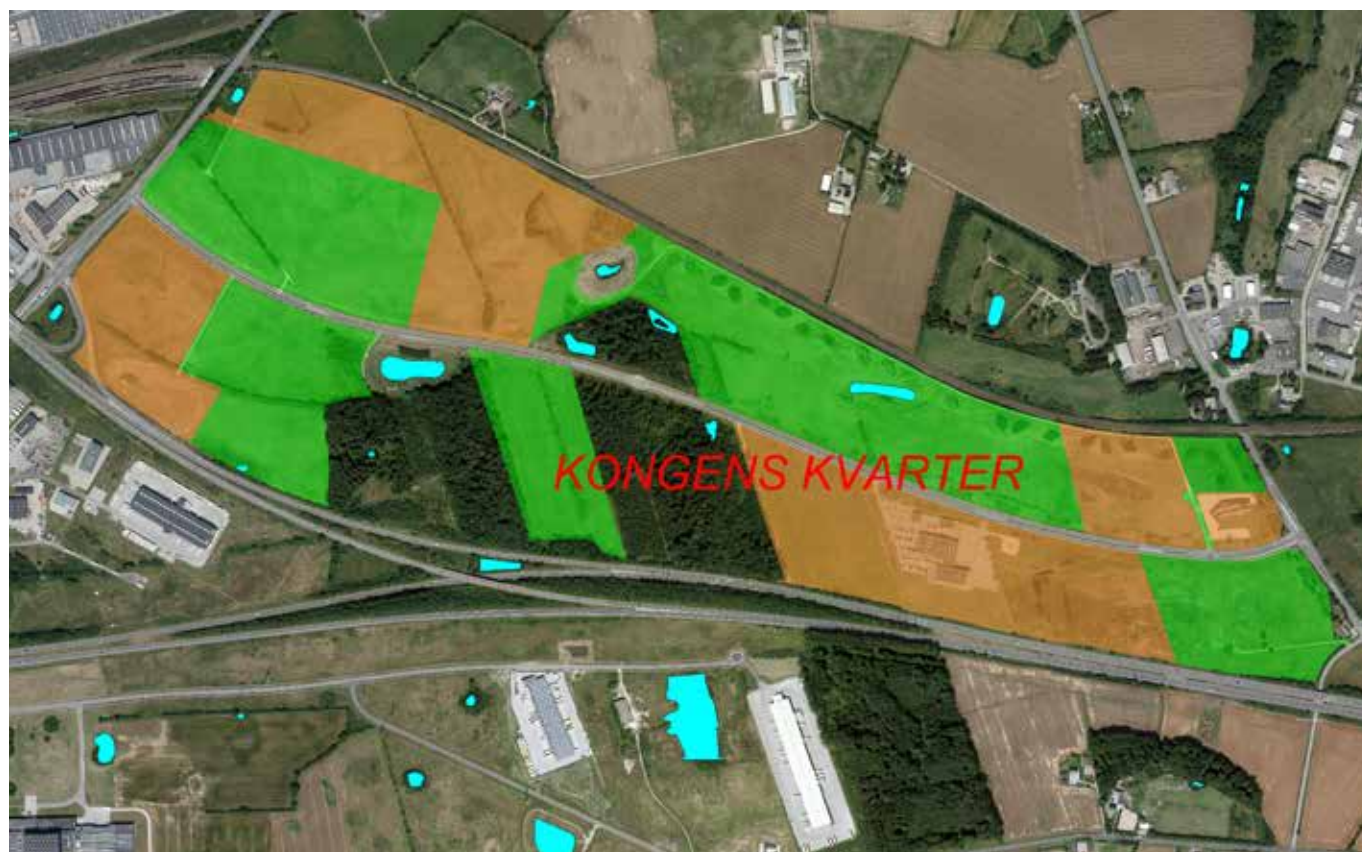
Luftfoto: DDO, copyright COWI. Matrikelkort: copyright Kort & Matrikelstyrelsen.